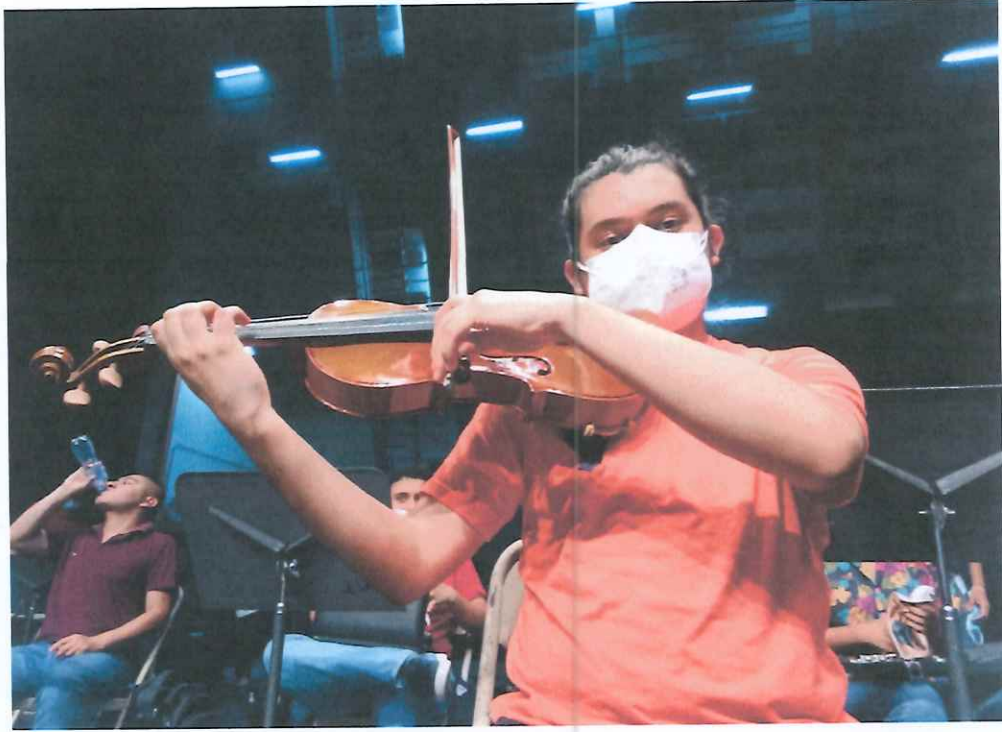
Tercer ensayo de Viola